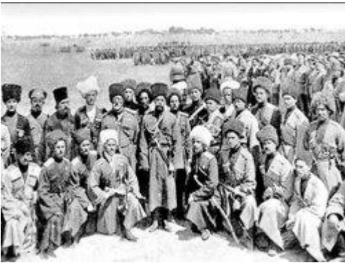
Resim 1. Çerkesler sınır dışı edilirken (1864)

Bu araştırma, XIX. Yüzyılın sonlarından buyana Türkiye siyasal hayatının bir parçası olan Çerkeslerin siyasal katılımlarını belirleyen faktörler ile sahip oldukları kimlikle siyasete katılmalarının hoş görülüp görülmediğine ilişkin bir takım çıkarımlarda bulunmaktadır. Çalışma, önce Çerkesler tarafından dile getirilen siyasal ve kültürel talepleri irdelerken devlet tarafından şimdiye kadar hangi taleplerinin tolere edildiğini ortaya çıkarmaya çalışmıştır.